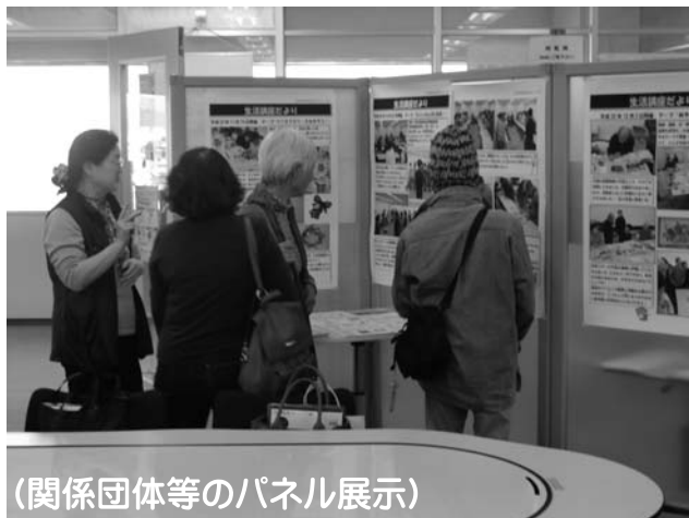
(関係団体等のパネル展示)

平成 26 年 11 月 5 日 (水) ~ 10 日 (月) の期間に「岐阜県聴覚障害者情報センター ふれあい Week」を開催いたしました。